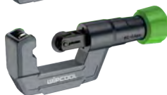
HC-54 Cuchilla de repuesto incorporada